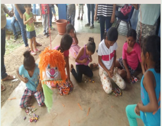
Momentos felices que compartieron con los miembros de Fundación.