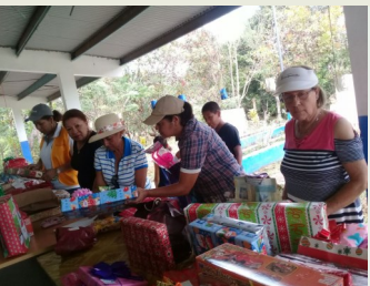
Organizando los regalos que serán entregados a los niños.

Nuestro agradecimiento las empresas y personas que nos colaboraron para hacer felices a estos niños.