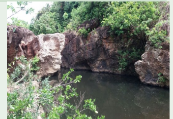
El Chorro de los Duendes, rodeado de exuberante flora

Para tener una experiencia diferente, este debe ser su próximo destino turístico, de seguro que lo disfrutará.