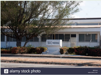
Planta de la Nestlé en Natá