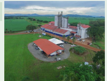
Complejo Agroindustrial Calesa en Natá de los Caballeros