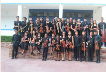
La Orquesta completa con integrantes de tres grupos musicales