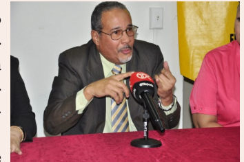
En los foros nacionales e internacionales, ineludible defensor de la clase trabajadora

En atención a que próximamente Natá cumplirá 500 años de fundación, desde ahora está participando y transmitiendo iniciativas para esta importante celebración histórica