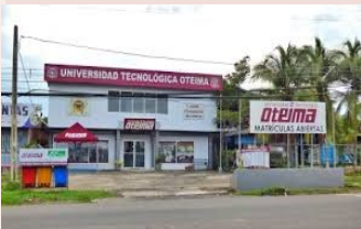
Sede Santiago de Veraguas. Promoviendo la cultura en las provincias centrales

Auguramos el mayor de los éxitos, entre dos instituciones que comparten objetivos culturales. Felicitaciones.