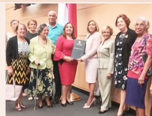
La Presidenta de la Asamblea entrega el Proyecto de ley a la H.D. Castañeda, en presencia de los miembros de Funac y el Alcalde Municipal.

Actualmente esperamos con ilusión que el Presidente de la República sancione dicha Ley y el presupuesto correspondiente, lo cual será un gran apoyo que permitirá dar mantenimiento a los monumentos históricos y continuar avanzando con el museo histórico religioso, entre otros.