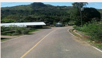
Esta es la carretera que nos conduce a Las Huacas.

Es una comunidad apacible, a unos 29 kilómetros de la ciudad de Natá, que gracias a una carretera en excelentes condiciones, se integra al desarrollo socioeconómico.