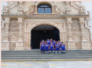
En la entrada de la majestuosa Escuela Normal, luciendo orgullosamente la camiseta de Coclé.