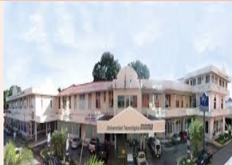
Universidad Tecnológica Oteima - Sede Central. David - Chiriquí.